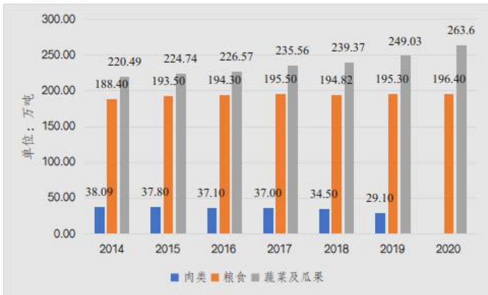
图 1 2014-2020 年德阳市主要农产品产量发展概况

“十四五”期间，德阳市将重点发展粮油、生猪两大主导产业，蔬菜、水果、食用菌、中药材、蚕桑等五大特色产业；围绕“双圈层”农业产业大环线，布局 24 个特色乡镇和 10 个现代农业园区，建设 3 个农产品加工园区和 1 个部级农产品交易市场，最终构建“2531”现代农业产业体系，因此德阳市农业物流体系要构建相应格局服务于现代农业发展。